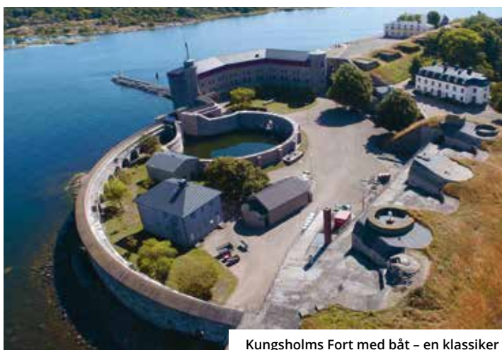
Kungsholms Fort med båt – en klassiker

Upplev världsarvet på egen hand eller med hjälp av app-guide i mobilen. Många av platserna är öppna för allmänheten, medan vissa ligger inom militärt område som kan besökas via en bokad tur. Vill du uppleva världsarvet till havs så erbjuder skärgårdstrafiken digital guidning ombord.