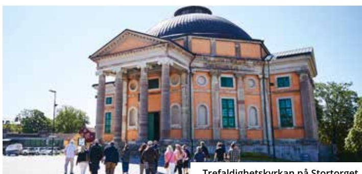
Trefaldighetskyrkan på Stortorget