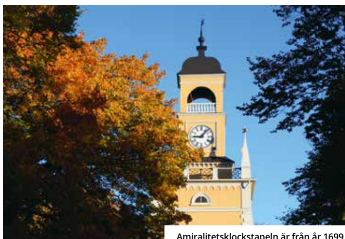
Amiralitetsklockstapeln är från år 1699