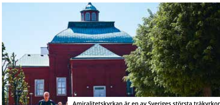
Amiralitetskyrkan är en av Sveriges största träkyrkor