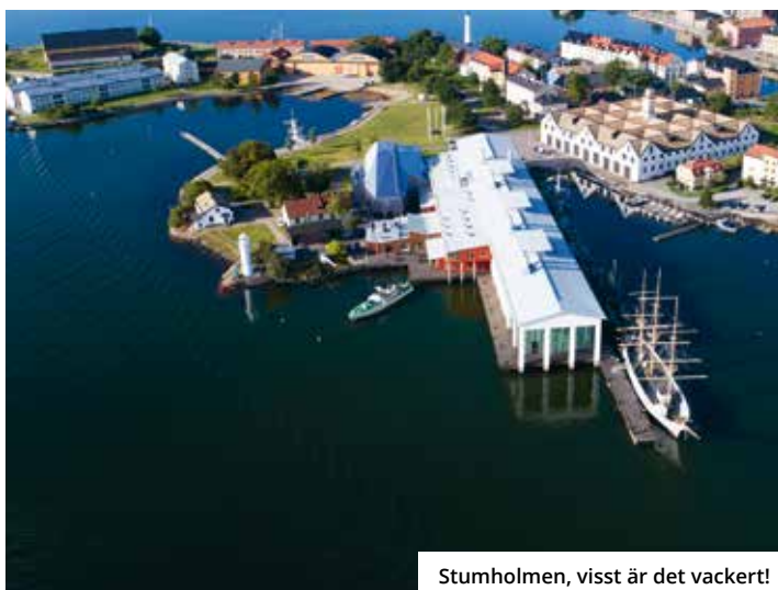
Stumholmen, visst är det vackert!