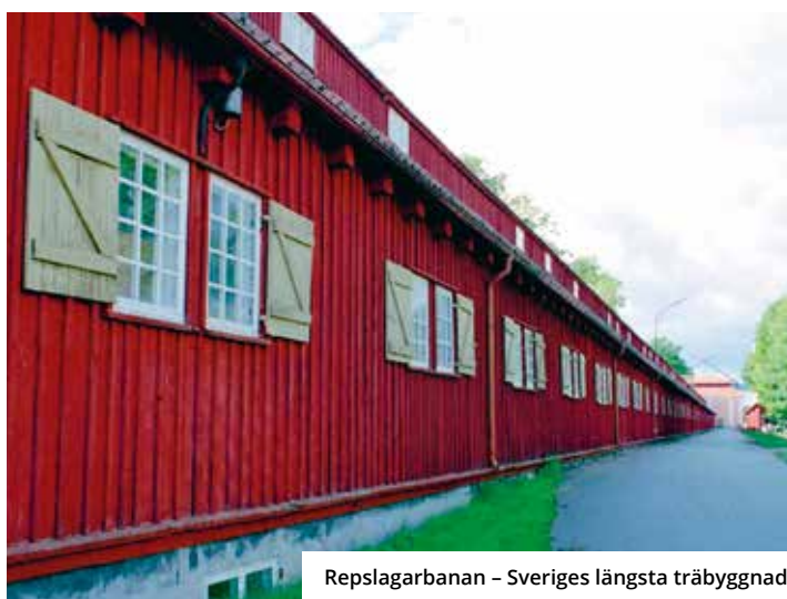
Repslagarbanan – Sveriges längsta träbyggnad